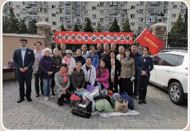
天通苑党支部《向贫困山区献爱心送温暖》 主题党日 活动