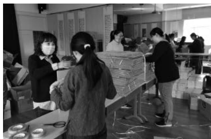
工作人员分拣装箱和打包重阳节慰问物资