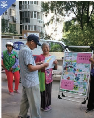
望京望京二支部开展垃圾分类我践行 主题党日 活动