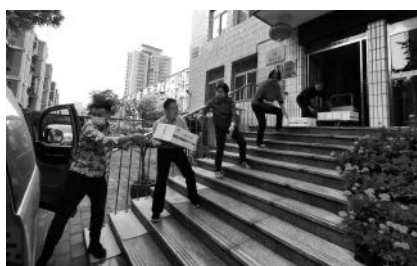
工作人员搬运重阳节慰问物资