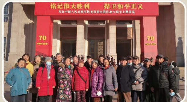
望京各支部参观纪念中国人民志愿军抗美援朝 出国作战70周年主题展