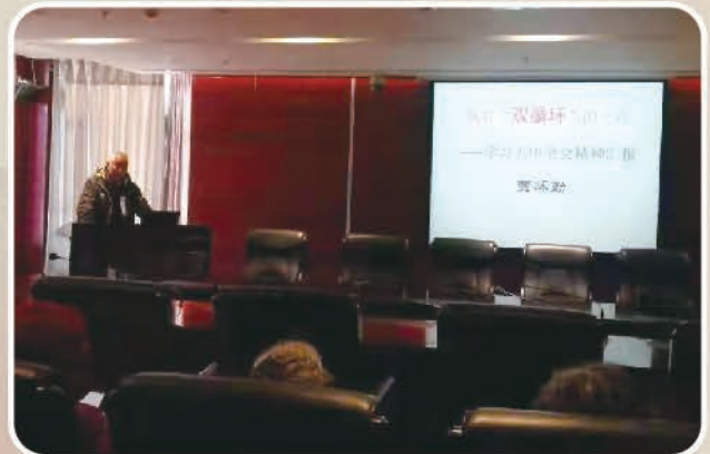
汇新楼党支部举办“学习五中全会精神” 主题党日 党课