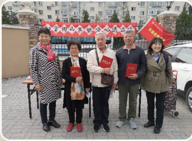
天通苑党支部《向贫困山区献爱心送温暖》 主题党日 活动