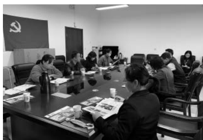
工作人员去高校调研