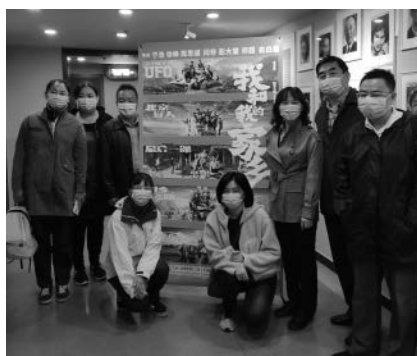
在职党支部观影《我和我的家乡》