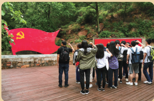
惠新里第一党支部组织主题党日活动