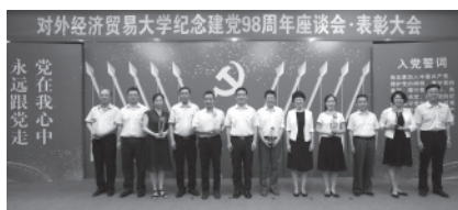
离退休党委荣获获校级先进党组织