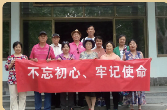
芍药居党支部组织主题党日活动