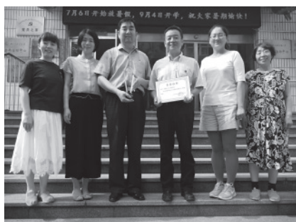
离退休党委荣获获校级先进党组织