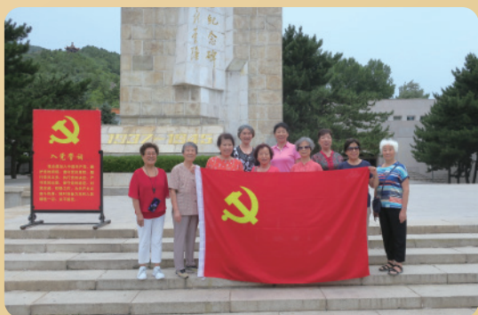
天通苑党支部参观京北抗战纪念馆