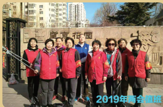
望京一党支部组织党员清洁小区周边环境