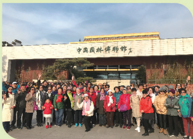
我处组织离退休女同胞共度“三八”妇女节