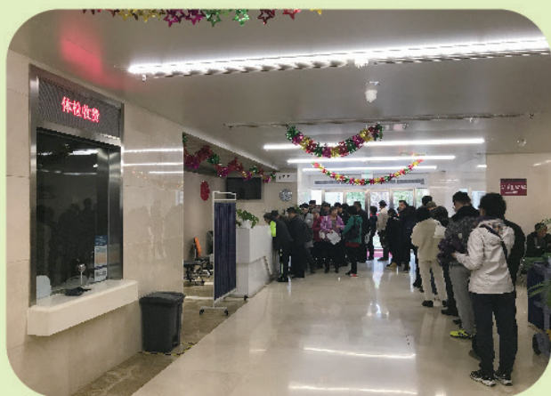
我校2019年离退休人员健康体检工作进展顺利