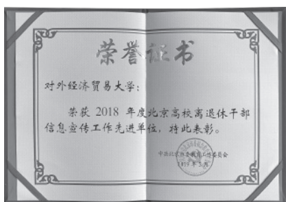
离退休处荣获2018年度北京高校 离退休干部信息宣传工作先进单位