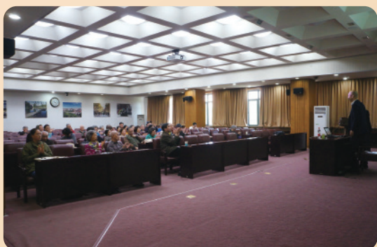
处党委召开理论中心组扩大会暨 国际形势报告会