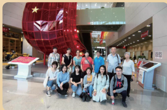
惠新里第三党支部组织主题党日活动