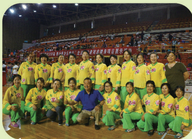
我校获北京高校老同志健身项目展示活动 “阳光风采奖”