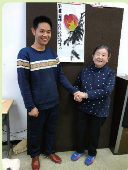
90后绘画老师与「90」后学生