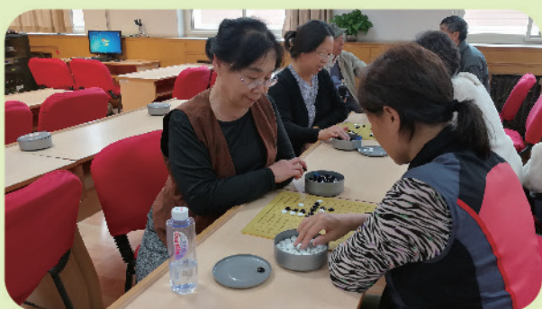
围棋爱好者参加教工委活动