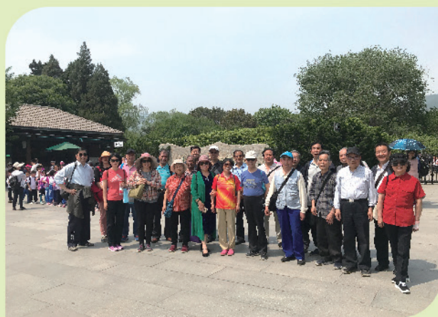
我处组织老同志春游踏青北京植物园