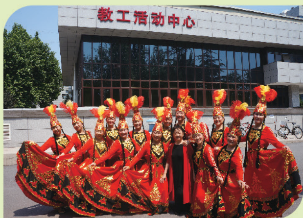
我校老年舞蹈队参加2019年北京老教育工作者 文艺演出