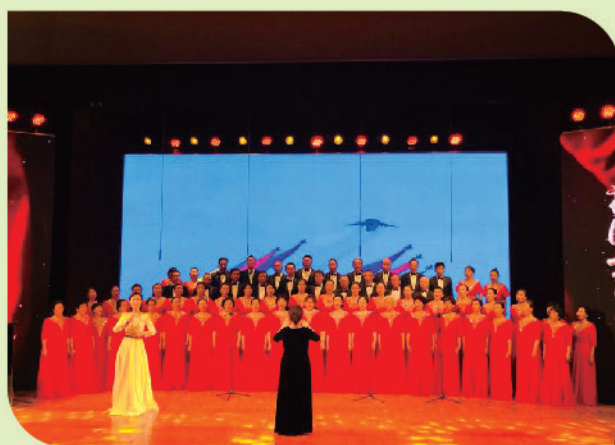
老年大学合唱团联合“惠风”教职工合唱团， 参加我校“歌颂新时代 礼赞新中国”合唱活动