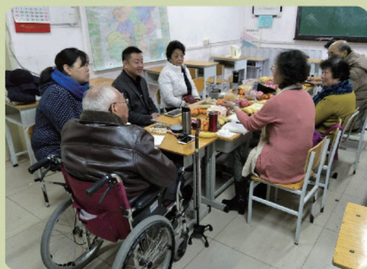
西三旗党支部新年茶话会