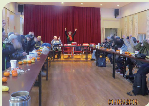
望京第一党支部新年茶话会