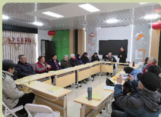
和平里党支部新年茶话会