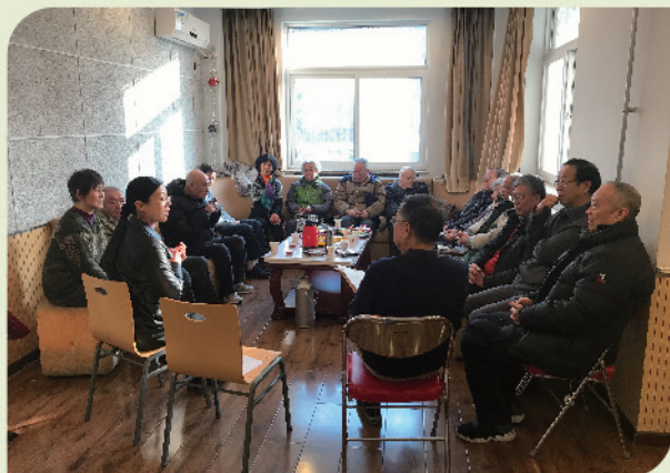
惠新里第二党支部新年茶话会