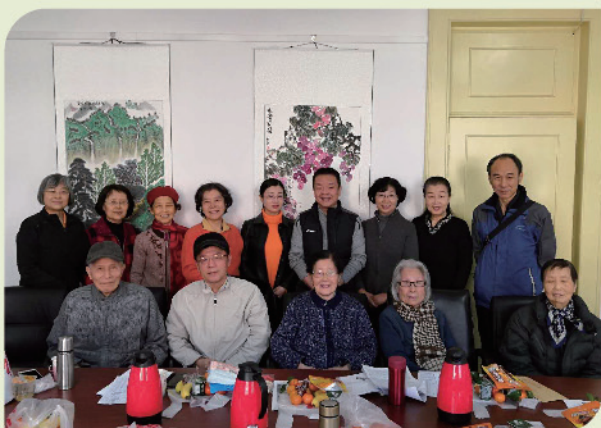
二里沟党支部新年茶话会