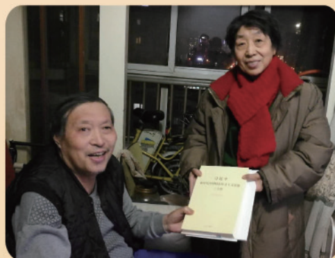
望京第一党支部将习近平著作送到行动不便的党员手中