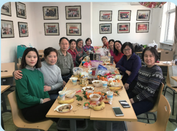
英语班学员贺新春茶话会