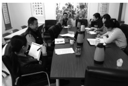
在职党支部民主生活会