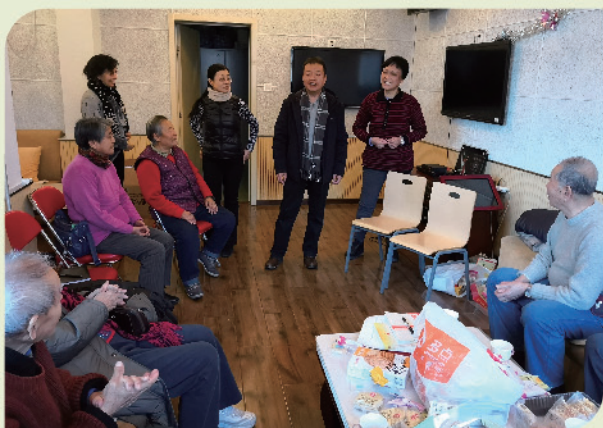
惠新里第四党支部新年茶话会