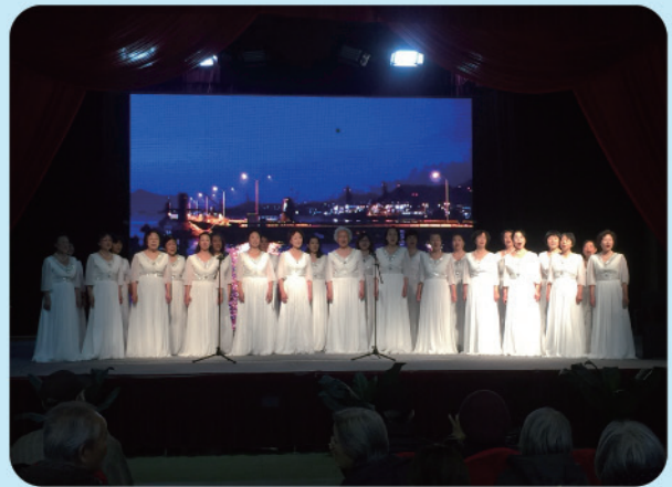
老年大学学员到养老院慰问演出