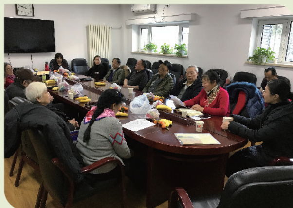
台基厂党支部新年茶话会