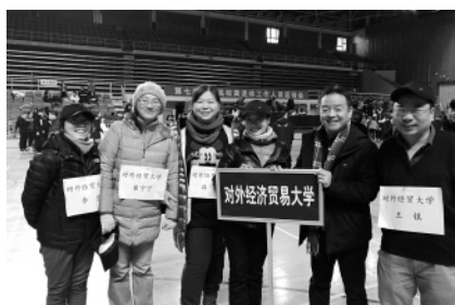
在职工作人员参加教工委举办的 趣味运动会