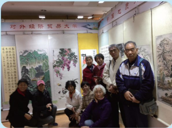
书画爱好者参观北京高校老同志书画作品展