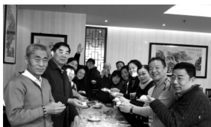
离退休处开展二级关怀活动