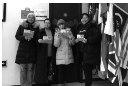
在职工作人员参加校工会新年联欢活动