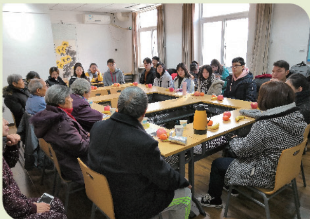
惠新里第一党支部新年茶话会