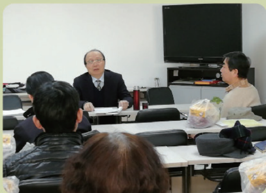
望京二党支部新年茶话会