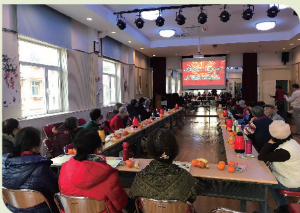
天通苑、惠新里三党支部新年茶话会