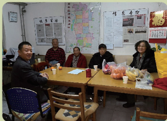
小石桥党支部新年茶话会