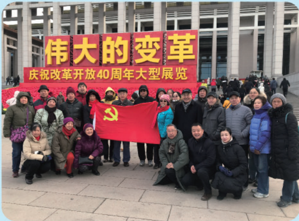
离退休处党委组织离退休党支部书记委员观看“伟大的变革——庆祝改革开放40周年大型展览”