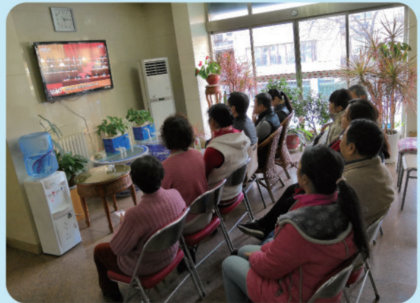
离退休处党委组织党员收看庆祝改革开放40周年讲话大会直播