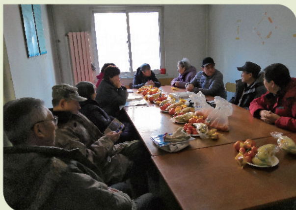
麦子店党支部新年茶话会