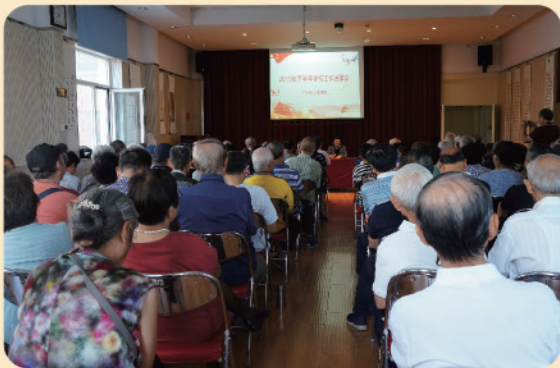
离退休处举办2019年下半年学校 工作通报会