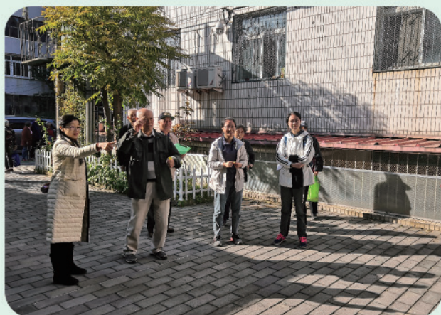
我处举办2019年离退休人员趣味运动会