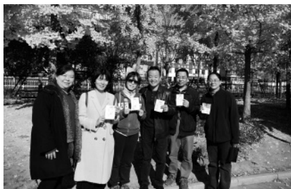
在职分工会成员参加校工会健步走活动