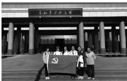
在职党支部活动：参观香山革命纪念馆