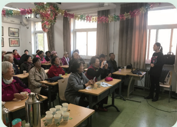
关于老年人的营养健康饮食的讲座