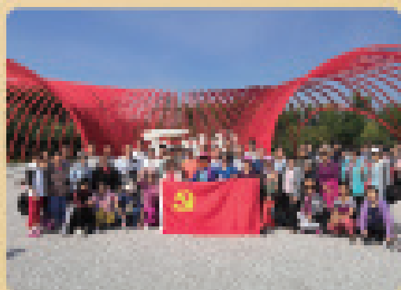
西辽体处党委组织党支部书记慰问会