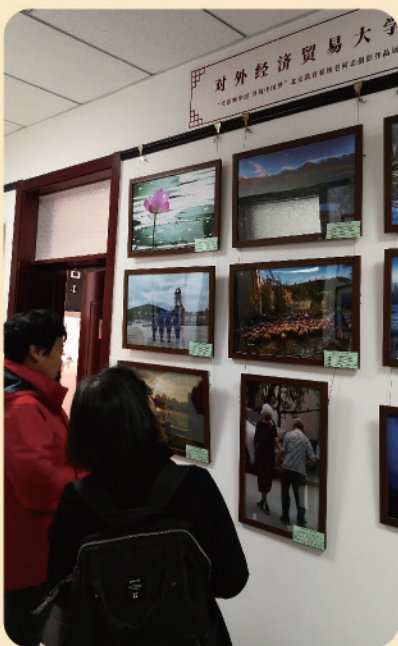
我校选送老同志的摄影作品参加 北京教育系统老同志摄影作品展