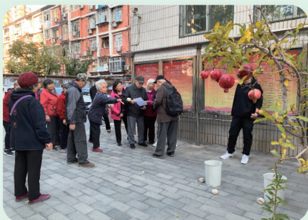
我处举办2019年离退休人员趣味运动会