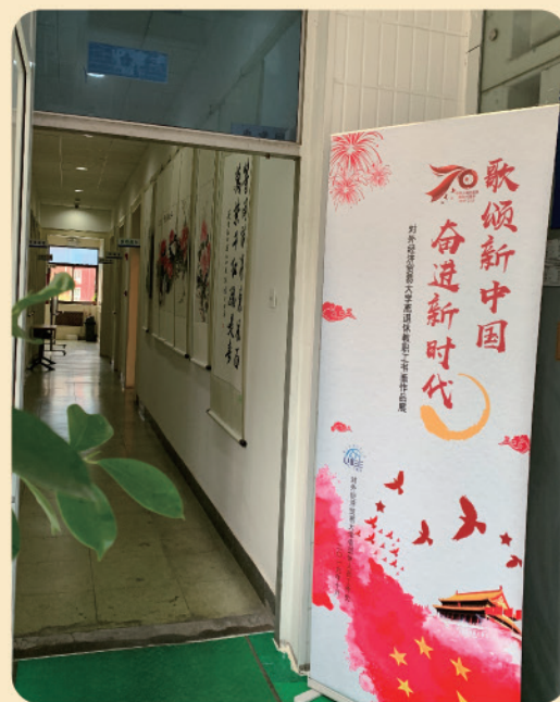
离退休教职工书画作品展在活动中心 分批次展出