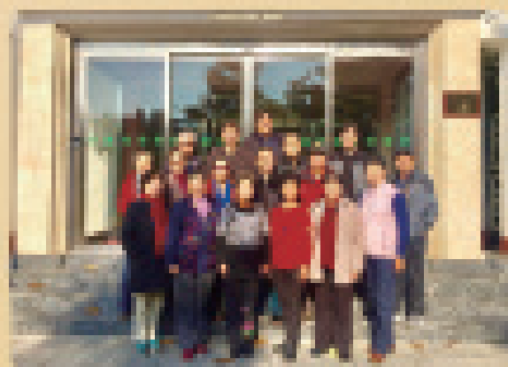
我校总协西辽体党委支部书记支委参加市教工委举办的北京高校离退休干部党支部书记培训班