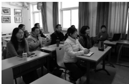
工作人员的业务学习：“编辑能力提高班”