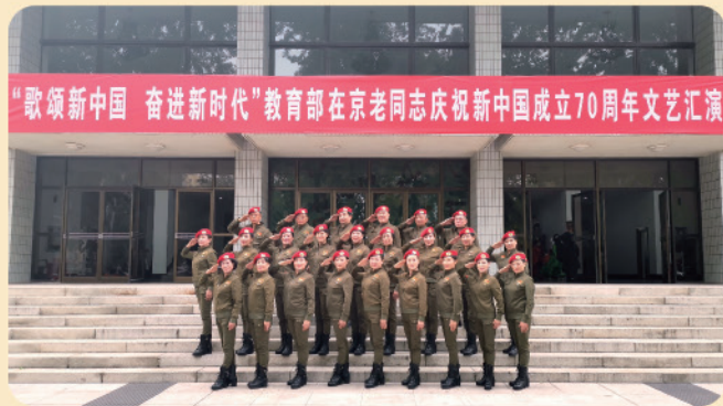
我校老年模特队参加2019年教育部在京老同志 庆祝新中国成立70周年文艺汇演