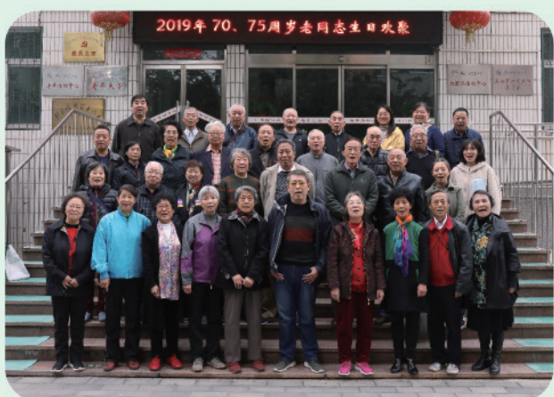
我处为我校70周岁、75周岁老同志举办集体生日会