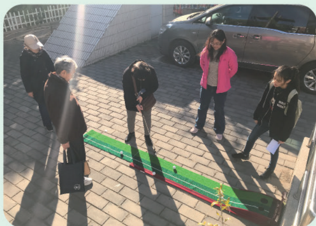
我处举办2019年离退休人员趣味运动会