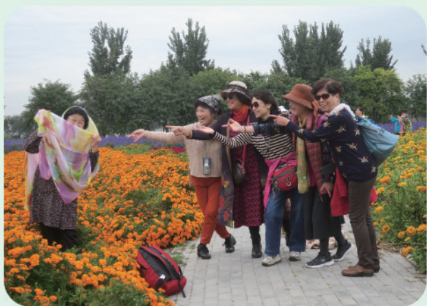
我处组织开展2019年离退休老同志秋游活动