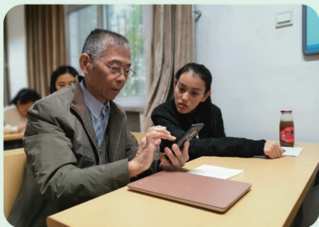
我处举办手机电脑一对一辅导活动