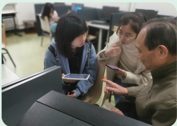
我处举办手机电脑一对一辅导活动