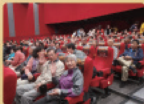
在机关支部，离退休干部党支部书记等联合观看“我和我的祖国”