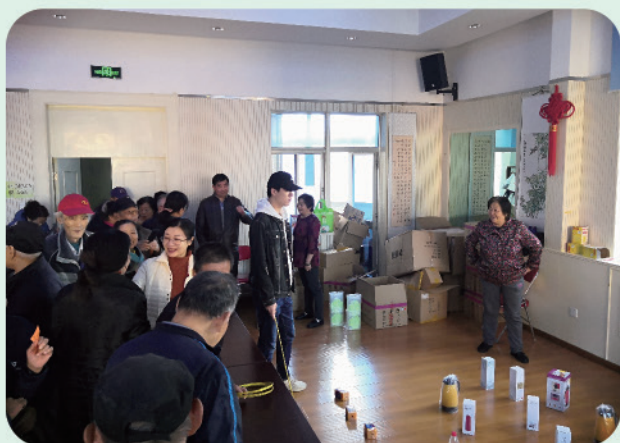
我处举办2019年离退休人员趣味运动会