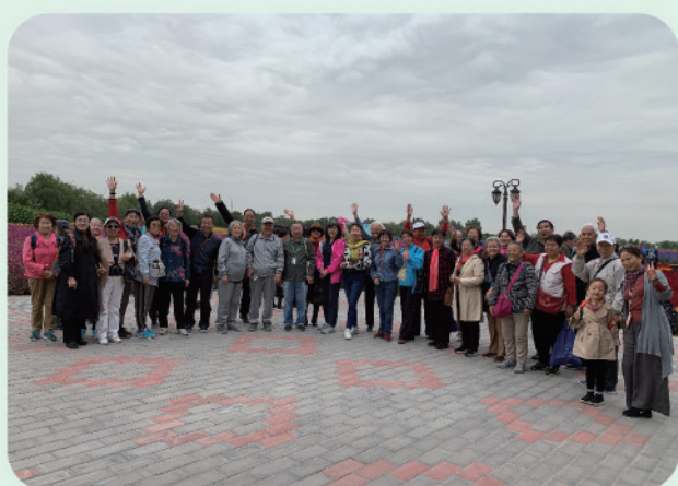
我处组织开展2019年离退休老同志秋游活动