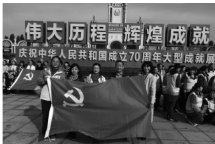
在职党支部活动：参观“伟大历程 辉煌成就——庆祝中华人民共和国成立70周年成就展”