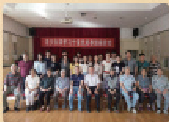
西辽体处党委与机关工委联合召开《老少支部学习《习近平新时代中国特色社会主义思想》座谈会》