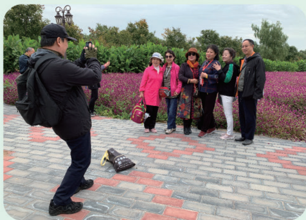
我处组织开展2019年离退休老同志秋游活动