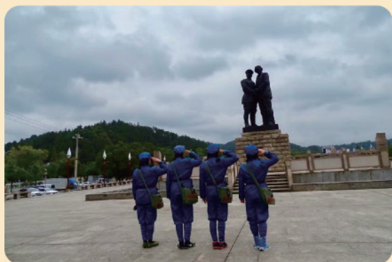
董中颖：向先烈致敬