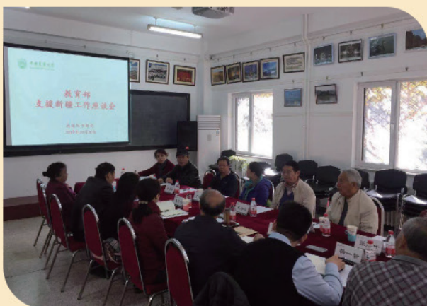
我校退休教师代表参加教育部支援新疆 工作座谈会