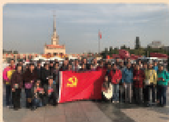
西辽体处党委开展“不忘初心 牢记使命”主题党日活