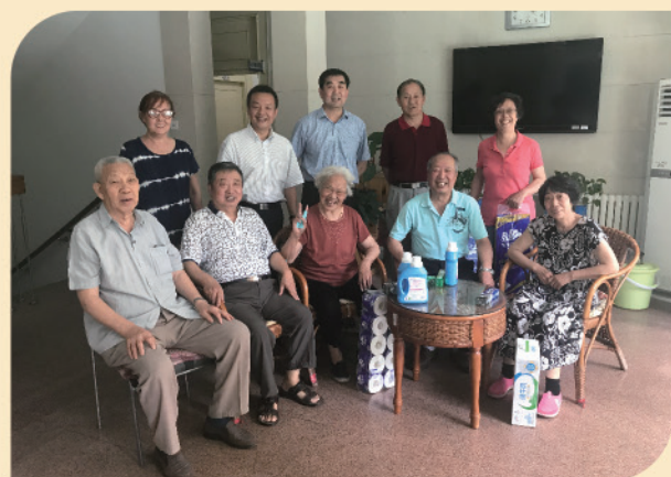
扑克牌协会举办友谊赛