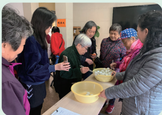
我处举办2019年离退休人员趣味运动会