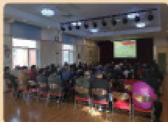
西辽体处党委召开“不忘初心 牢记使命”专题党课暨理论中心组学习，支部书记会后培训会